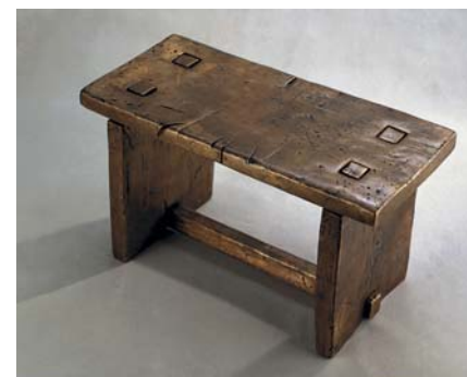
Дронов М. В. Скамейка. 2001. Бронза. 22x38x18

У каждого из наших героев своя история, но есть одно, что их объединяет, – это любовь. Она на всю жизнь связала их с нашей страной, с нашей культурой, с нашей непростой действительностью, с нашими людьми. Немцы и русские, мы такие разные... Что же они увидели в нас, что нашли в тайниках наших душ?