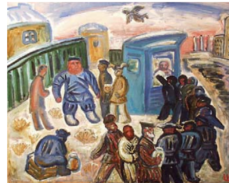
Шагин Д. В. У ларька. 1988. Холст, масло. 79,5x99,7

Как-то вечером после тяжёлого процедурного дня, трёхразового подхода к минеральному водопою, обильного и тоже трёхразового питания, блаженного послеобеденного сна и кружки пенного "Великопоповского козе-