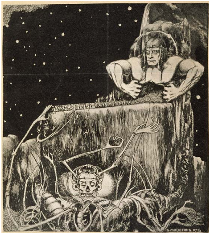
Масютин В. Н. Жизнь и смерть. 1908. Гравюра, цинк. И.: 45,2х33. Л.: 28,5х25,7