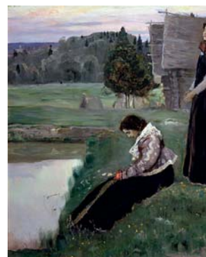
Нестеров М. В. Думы. 1900. Дерево, масло. 66x54