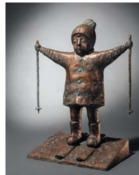
Бычков С. Ю. Лыжник. 2009. 80x59x36

Для ровесницы Хорста Зигрид окончание войны ознаменовалось приходом советских войск в родную сак-