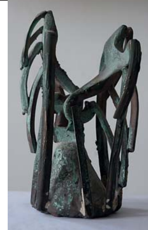
Позин А. В. Био-ключи. Бронза. 15x11x9

Оставив позади людские страсти и переживания, мы попадаем в зимний лес четвёртого зала, где "Морозовое дозором обходит владенья свои". В отличие от поэмы Некрасова, нас ждёт не яркий солнечный день, а звёздная лунная ночь. Но света достаточно, чтобы разглядеть в белом ночном пространстве лесных обитателей, неожиданных гостей, сказочных существ и непознанные объекты человеческой деятельности.