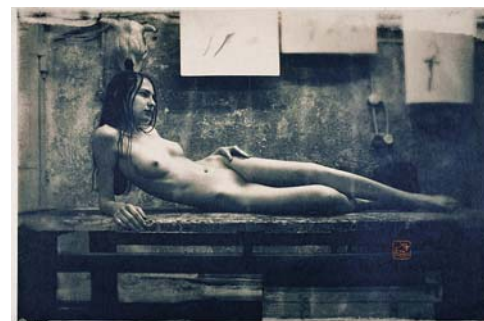
Железняков М. А. Из серии "Скульпторы и Галатеи". 2009. 46x31

В сознании многих миллионов жителей нашей планеты Россия ассоциируется с суровыми зимами, невыносимым холодом, льдами, сугробами, медведями и, конечно, водкой. Не могу не согласиться с подобным стереотипом, и выбор Карстена мне кажется очень правильным. Русская зима – испытание и в прямом, и в переносном смысле. Она проверяет на прочность и чувства, и здоровье, одновременно являясь мощным стратеги-