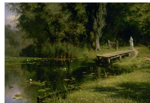
Поленов В. Д. Заросший пруд. 1880. Холст, масло. 44x64,5

одолеть любые стереотипы, трудности, несчастья, помогает выжить, не сломаться, сохранить душу и лучшие человеческие качества.