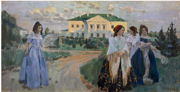
Борисов-Мусатов В. Э. Прогулка при закате. 1903. Холст, масло. 53,5x104

Однажды мы с мужем отдыхали в Карловых Варах в бывшем санатории четвертого управления с гордым названием "Империа". После пражских бархатных событий и белорусской Беловежской пуши контингент привилегированного медицинского учреждения сильно изменился. В него устремились хорошо зарабатывающие сибиряки, вывозящие из Чехии кроме поправленного здоровья хрусталь, посуду и меховые изделия. Бывшие наши соотечественники удовлетворяли амбиции прошлой советской жизни. Немецким соседям-пенсионерам государство тогда оплачивало лечение за ближайшим рубежом. Приезжали и отдельно взятые граждане вроде нас хлебнуть целебной водицы.